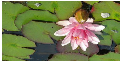
2. Original vertikal spiegeln über Kontextmenü "Verlustfreie Operationen"