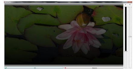
3. Intensitätsmaske - Maskierung / Intensitätsmaske auswählen - gerade Linie von ca. der Mitte des Bildes bis an den oberen Rand ziehen - Einstellungen vornehmen -> desto dunkler desto transparenter - Dialog mit OK bestätigen - mit "Markierung kopieren" in die Zwischenablage übernehmen