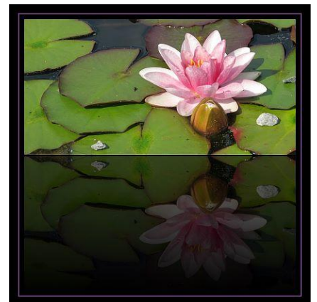
6. bei Bedarf rahmen - wenn's gefällt -> Rahmen